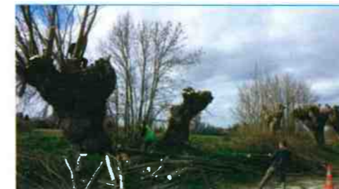
Emondage d'arbres têtards

Afin de maintenir l'écoulement naturel des eaux, d'assurer la bonne tenue des berges et de préserver la faune et la flore, le Symvahem a entrepris des travaux dès ce printemps et pour une durée de trois ans. Avec une enveloppe de 30 000 euros par an, les chantiers d'entretien seront sélectionnés selon un ordre de priorité présenté ci-dessous et en fonction des contraintes budgétaires.